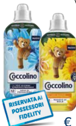
COCCOLINO AMMORBIDENTE CONC. VARI TIPI 42LAV