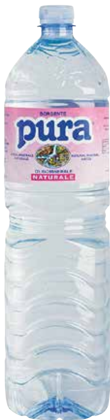
PURA ACQUA NATURALE 2 LT