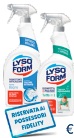
LYSOFORM SPRAY VARI TIPI 700 ML