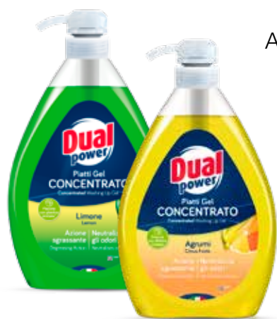
DUAL POWER DETERSIVO PIATTI GEL AGRUMI/LIMONE VERDE 1 LT