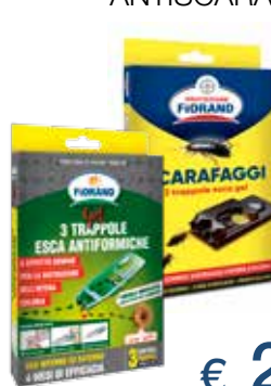
FIORAND TRAPPOLE ESCA ANTIFORMICHE/ ANTISCARAFAGGI X3PZ