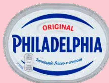
PHILADELPHIA 250 G