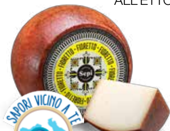
SEPI PECORINO FIORETTO ALL'ETTO