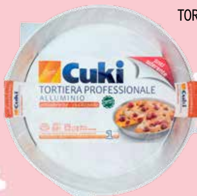
CUKI TORTIERA EXTRA ALLUMINIO ALTO SPESSORE