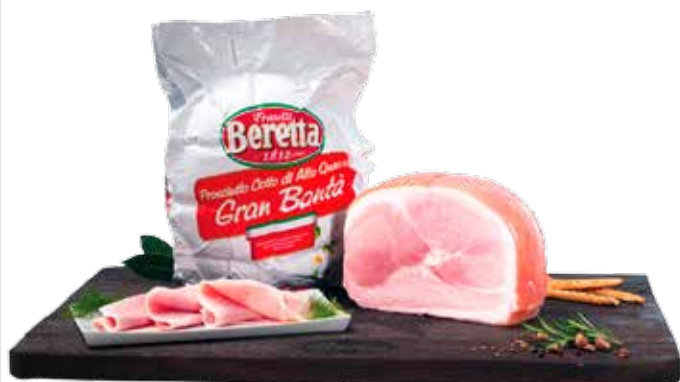
BERETTA PROSCIUTTO COTTO ALTA QUALITÀ GRAN BONTÀ ALL'ETTO