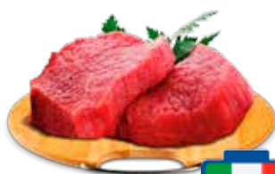
TAGLIATA MAGRA DI BOVINO ADULTO