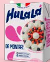
HULALÀ DA MONTARE SENZA LATTOSIO 200 ML