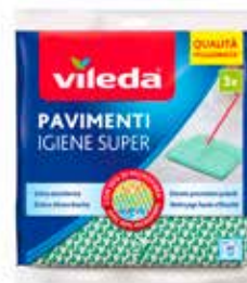
VILEDA PANNO PAVIMENTI IGIENE SUPER X3PZ