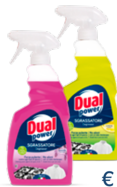
DUAL POWER SGRASSATORE ULTRA VARI TIPI 750 ML