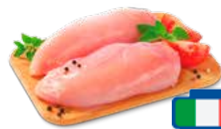
PETTO DI POLLO INTERO