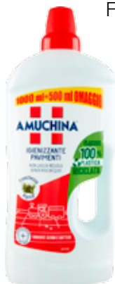
AMUCHINA DETERSIVO PAVIMENTI FRESH.ALPINA 1500ML