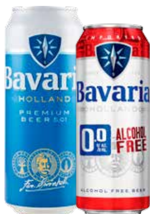
BAVARIA BIRRA PREMIUM CLASSICA/ANALCOLICA LATTINA 500 ML