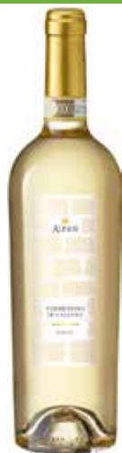
CANTINA DEL MONTI ALINOS VERMENTINO DI GALLURA DOCG 750 ML