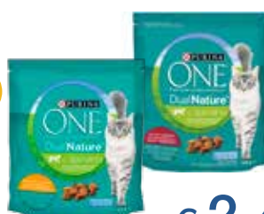
PURINA ONE DUALNATURE CROCCANTINI PER GATTO VARI TIPI 400 G