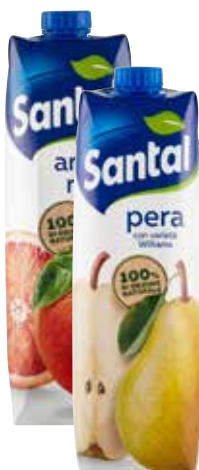
SANTAL SUCCHI VARI GUSTI 1 LT