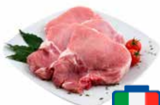
BISTECHE DI LOMBO DI SUINO