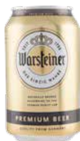
WARSTEINER BIRRA IN LATTINA 330 ML