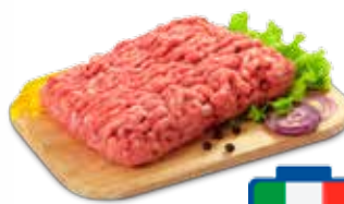
MACINATO MISTO PER RAGÙ