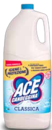
ACE CANDEGGINA CLASSICA 5 LT