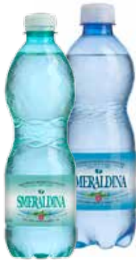
SMERALDINA ACQUA NATURALE NATURALE/GASSATA 500 ML