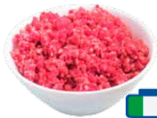
POLPA MACINATA DI SUINO