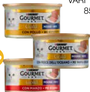
GOURMET GOLD MOUSSE PER GATTO VARI TIPI 85 G