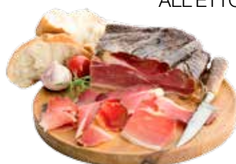
MERANO SPECK STAGIONATO 5 MESI ALL'ETTO