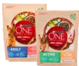
PURINA ONE CROCCHETTE PER CANE MINI ADULT/ACTIVE 800 G