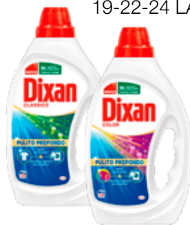
DIXAN LAVATRICE LIQUIDO VARI TIPI 19-22-24 LAVAGGI