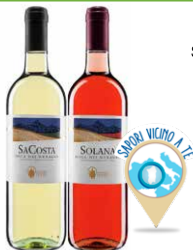
JERZU VINO SA COSTA/ SOLANA/ALUSTIA IGT 750 ML