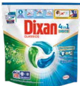
DIXAN LAVATRICE DISCS CLASSICO X28PZ