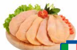
SCALOPPE DI POLLO