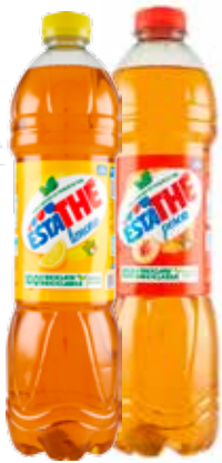
ESTATHÉ LIMONE/PESCA 1,5 LT