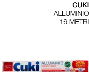
CUKI ALLUMINIO 16 METRI