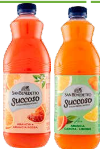
SAN BENEDETTO SUCCOSO VARI TIPI 900 ML