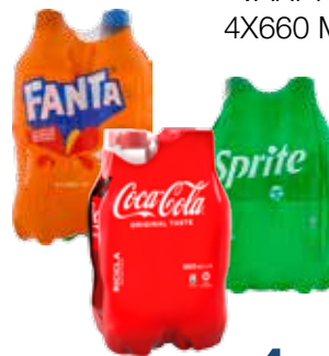
COCA COLA/ FANTA/SPRITE VARI TIPI 4X660 ML