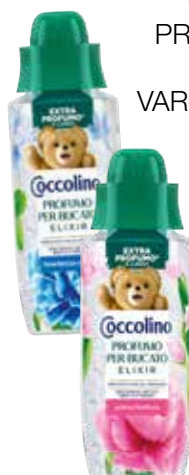
COCCOLINO PROFUMATORE BUCATO VARI TIPI 342 ML