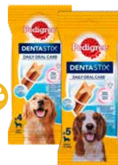
PEDIGREE DENTASTIX LARGE S/M/L