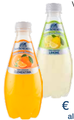
SAN BENEDETTO PASSIONE ITALIANA VARI TIPI 400 ML