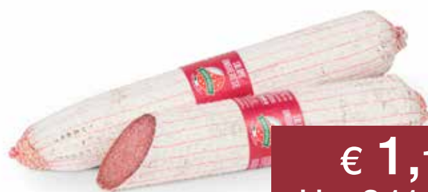
SORRENTINO SALAME UNGHERESE ALL'ETTO