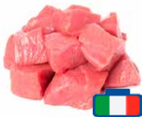
BOCCONCINI DI VITELLO