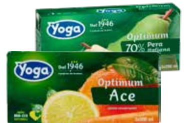
YOGA SUCCHI VARI GUSTI 3X200 ML