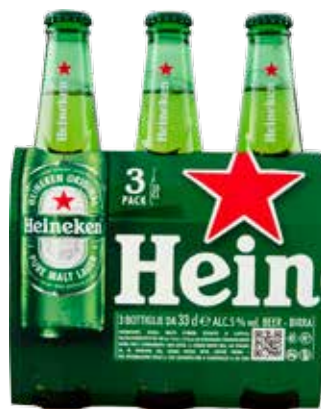
HEINEKEN BIRRA 3X33 CL