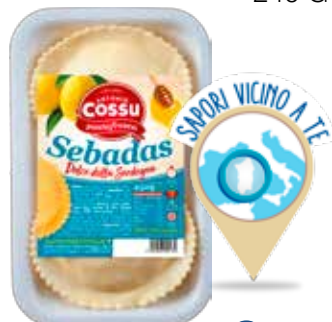
COSSU SEBADAS AL FORMAGGIO 240 G