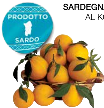
ARANCE NAVEL SARDEGNA AL KG