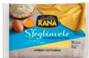
RANA LASAGNE SFOGLIAVELO FRESCHES ALL'UOVO 250 G