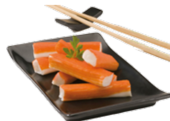
BASTONCINI DI SURIMI 12 PZ 200 G