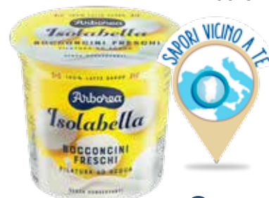
ARBOREA BOCCONCINI FRESCHI DI MOZZARELLA 200 G