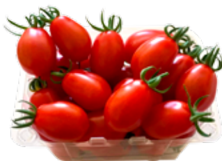
POMODORO DATTERINO CONF. 250 G