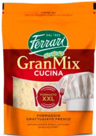
FERRARI GRANMIX GRATTUGIATO 475 G