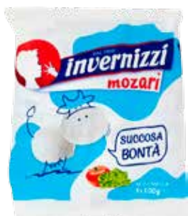
INVERNIZZI MOZZARELLA MOZARÌ 3X100 G