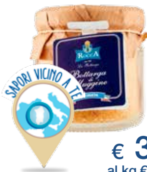
ROCCA BOTTARGA MUGGINE GRATTUGIATA VASO 40 G