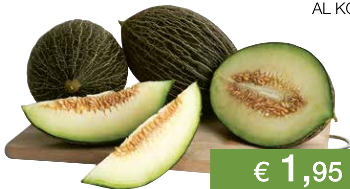
MELONE VERDE AL KG