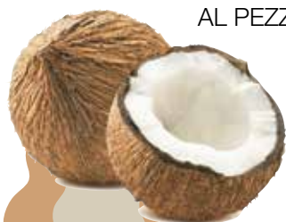
NOCE DI COCCO AL PEZZO