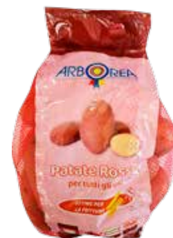
PATATE ROSSE RETE 2 KG