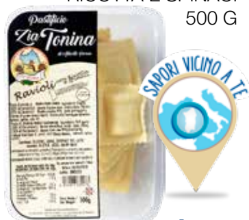
ZIA TONINA RAVIOLI CON RICOTTA E SPINACI 500 G