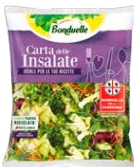
BONDUELLE VITALE CONF. 200 G