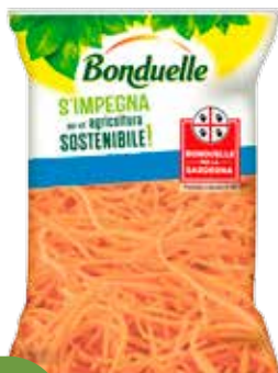
BONDUELLE VOGLIA DI CAROTE CONF. 200 G