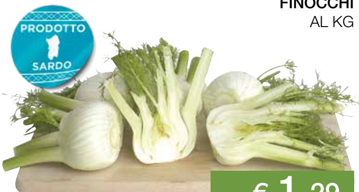
FINOCCHI AL KG