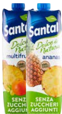
SANTAL SUCCHI S.ZUCCHERI AGGIUNTI VARI TIPI 1 LT