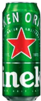
HEINEKEN BIRRA LATTINA 500 ML