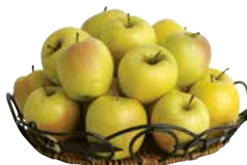
MELE GOLDEN AL KG