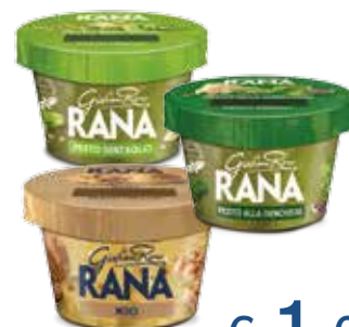
RANA PESTO FRESCO VARI TIPI 140 G