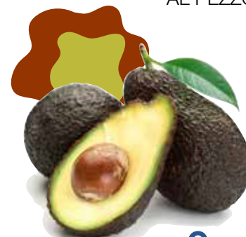
AVOCADO AL PEZZO