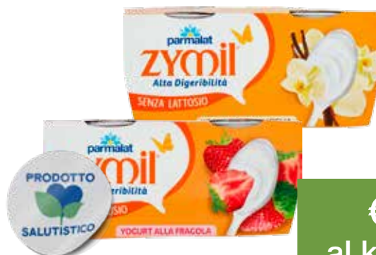
PARMALAT ZYMIL YOGURT S.LATTOSIO VARI TIPI 2X125 G