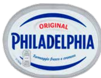
PHILADELPHIA ORIGINAL 250 G