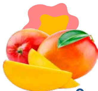
MANGO AL PEZZO