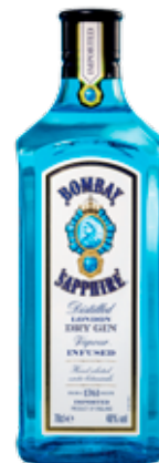
BOMBAY SAPPHIRE DRY GIN 700 ML