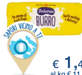
ARBOREA BURRO 125 G