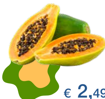
PAPAYA 350 G