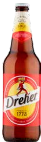
DREHER BIRRA BOTTIGLIA 66 CL