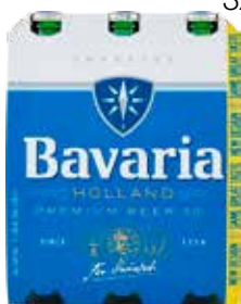
BAVARIA BIRRA PREMIUM BOTTIGLIA 3X33 CL