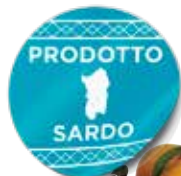
ARANCE NAVEL SARDEGNA AL KG