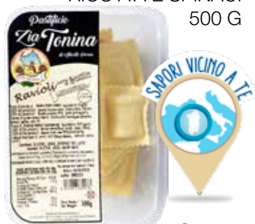
ZIA TONINA RAVIOLI CON RICOTTA E SPINACI 500 G