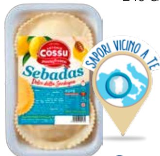
COSSU SEBADAS AL FORMAGGIO 240 G