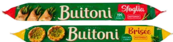
BUITONI PASTA ROTONDA SFOGLIA/BRISÉE 230 G