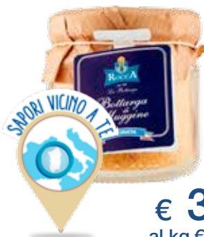
ROCCA BOTTARGA MUGGINE GRATTUGIATA VASO 40 G