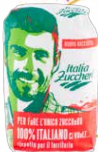
ITALIA ZUCCHERI ZUCCHERO 100% ITALIANO 1 KG