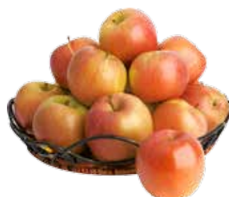
MELE FUJI AL KG