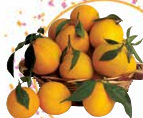
ARANCE WASHINGTON AL KG