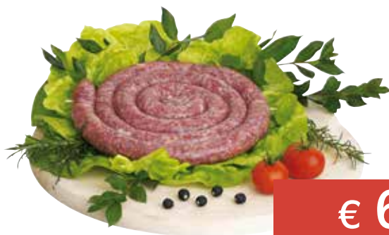
SALSICCIA (NOSTRA PRODUZIONE) AL KG