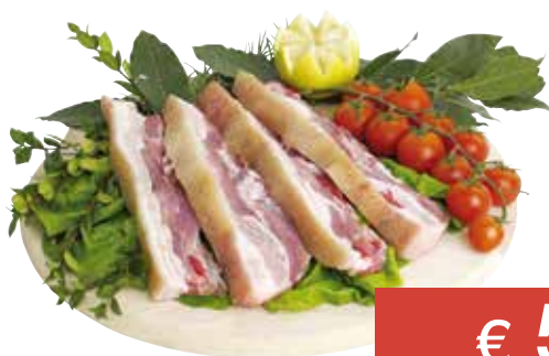
PANCETTA DI SUINO AL KG