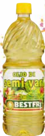
BESTFRJ OLIO DI SEMI VARI 1 LT