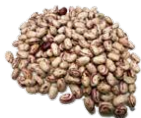
FAGIOLI SECCHI BORLOTTI-CANNELLINI/CECI/ FAVE/ LENTICCHIE MIGNON AL KG