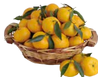
MANDARINI AL KG