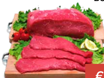
FETTINE SCELTE DI BOVINO ADULTO AL KG