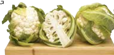
CAVOLFIOR AL KG