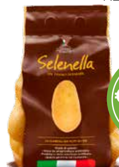
PATATE SELENIO RETE 1,5 KG