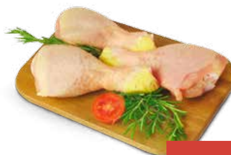
FUSI DI POLLO AL KG